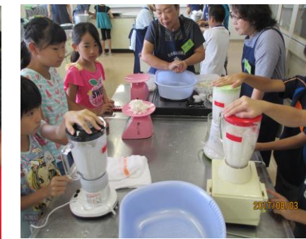
5. ミキサーでかくはんする