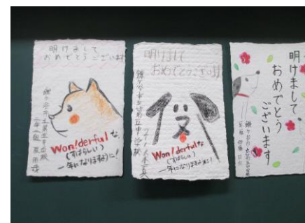
9. 完成した手すきはがき