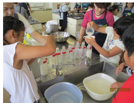
6. 糊を溶かしペットボトルにわせる