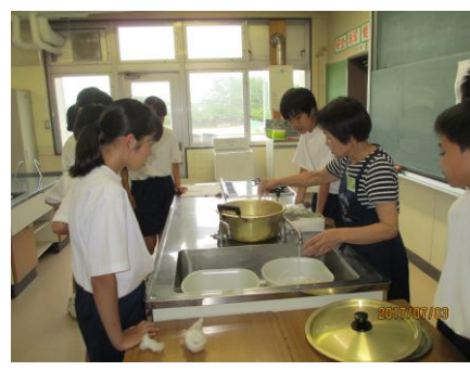
2. 牛乳パックを煮る