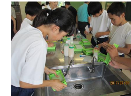
7. ペットボトル1本で1枚の手すきに流し込む

牛乳パックから手すきはがきの作り方 児童・生徒の皆さんと一緒に作成しています。 「この手すきはがき作りは東初富公民館との共催事業です」