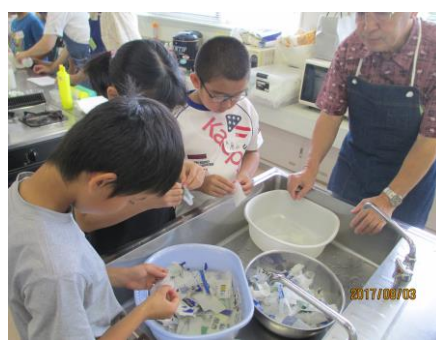
3. セロハンをはがす

ミニリハビリ教室 11月の教室「干支の色紙作り」 毎年作って干支が一巡しました。